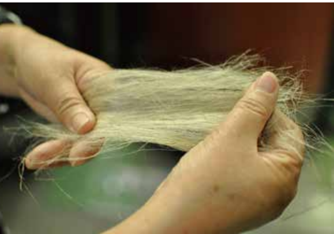
ベルギーリネン 糸になる直前の繊維